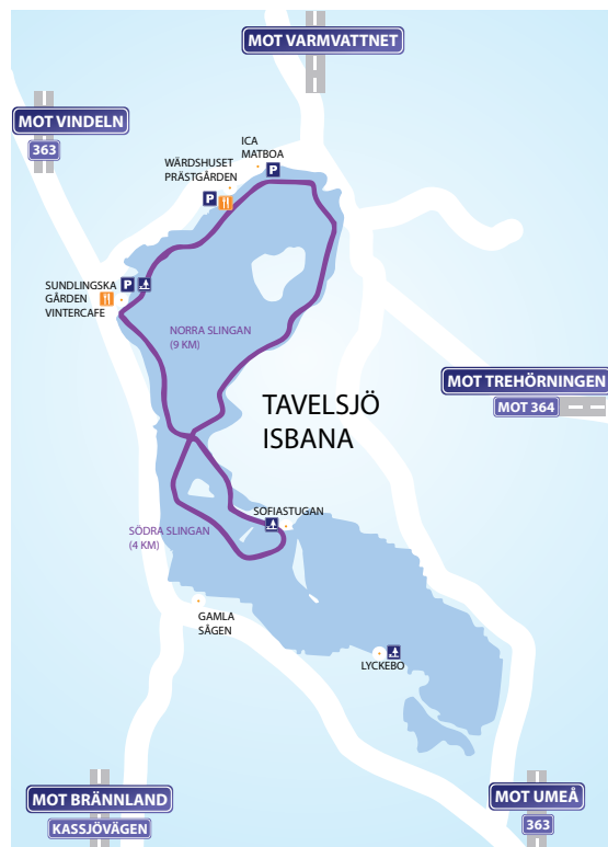
Tavelsjö isbana 2020, 13 km