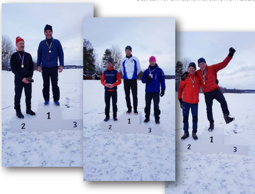
Guld, silver och brons medaljörer i Skridskomarathon SM 2020